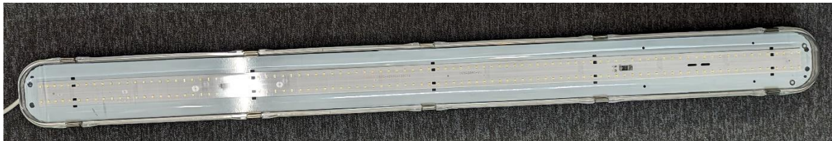
PHOTO DU SYSTEME TESTE